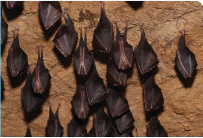
Colonie de Petits rhinolophes