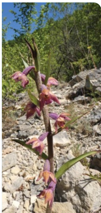
S. Gomez - CENB

Ces milieux à végétation basse , installés sur les buttes témoins et les coteaux calcaires bien exposés au soleil , recèlent une faune et une flore spécifiques , particulièrement riches. Les orchidées en sont certainement les meilleures ambassadrices. Pour ne citer qu'elles, la Céphalanthère rouge et la Limodore à feuilles avortées sont bien présentes sur plusieurs entités.