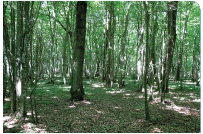
Hêtraie-chênaie de plateau

La destruction de leurs terrains de chasse , la disparition de leurs abris d'hibernation ou de reproduction , le dérangement par les humains, la pollution chimique, entre autres, menacent ces petits mammifères, pourtant protégés à l'échelle nationale.