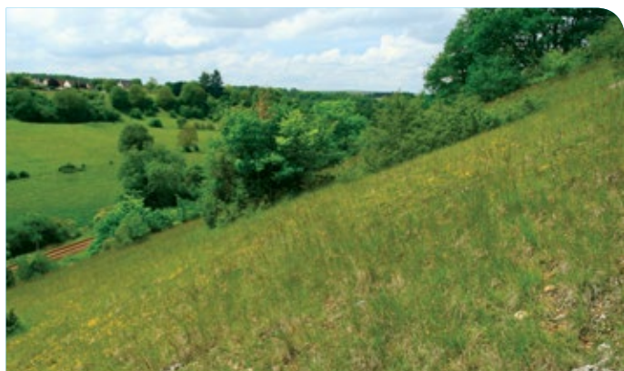
M. Jouve - CENB

Sur l'ensemble du site, les pelouses calcicoles ont régressé et sont globalement en mauvais état de «santé» . L'abandon et le manque «d'entretien» de ces milieux naturels entraînent en effet un embroussaillage important , nuisant au développement des espèces typiques.