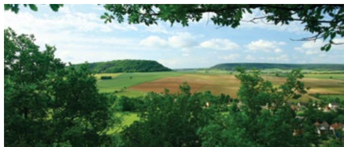
Butte témoin du Mont Breuvois, vue du Bois de la Roche

Ce sont des contrats passés pour 5 ans entre l'État et un agriculteur volontaire pour adopter sur ses parcelles des pratiques respectueuses de la nature. Ce dernier reçoit une contrepartie financière pour compenser les pertes de revenus ou les coûts supplémentaires engendrés.