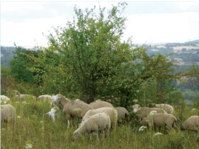
Pâturage par des moutons

Cela permet aux plantes et aux animaux typiques des pelouses calcicoles de continuer à vivre sur ces milieux.