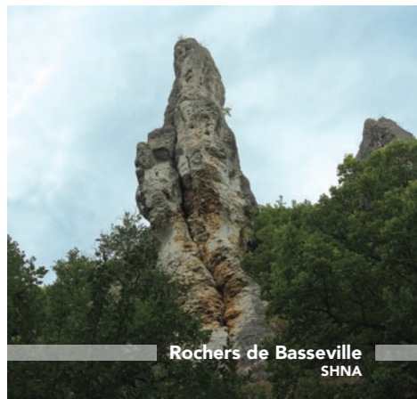
Rochers de Basseville SHNA

Ainsi, la Société d'Histoire Naturelle d'Autun a effectué en 2017 un premier inventaire des chauves-souris sur l'ensemble du site Natura 2000.