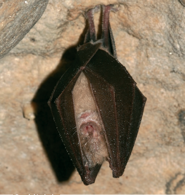
Grand rhinolophe S. Gomez - CENB