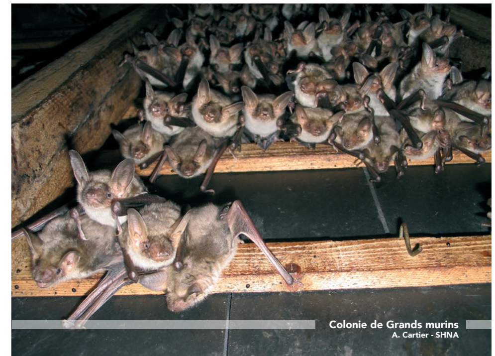
Colonie de Grands murins

Le retour au pâturage pour entretenir les pelouses calcaires du site Natura 2000 est actuellement étudié sur le territoire (cf. gazette d'information n°1 de décembre 2016). Préserver les milieux naturels permet en effet de protéger les plantes, les insectes et donc les espèces qui s'en nourrissent. La pose d'un panneau d'information ou d'éventuelles fermetures de cavités au public sont aussi des solutions à exploiter, plus particulièrement sur le site des Rochers de Basseville. Enfin, connaître c'est protéger ! La sensibilisation du public, des élus des territoires et des porteurs de projets sont des approches essentielles à la préservation des espèces et des milieux.